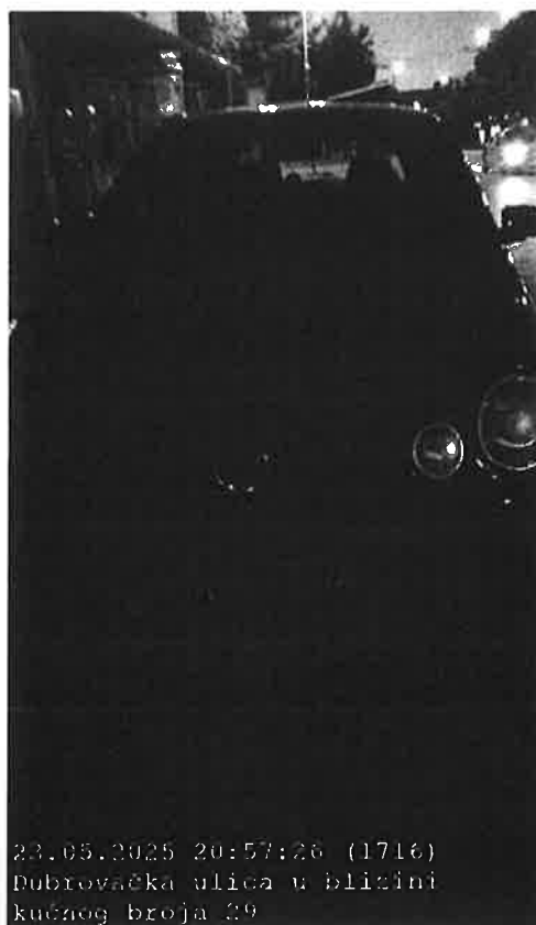
23.05.2025 20:57:26 (1716) Dubrovačka ulica u blizini kućnog broja 29