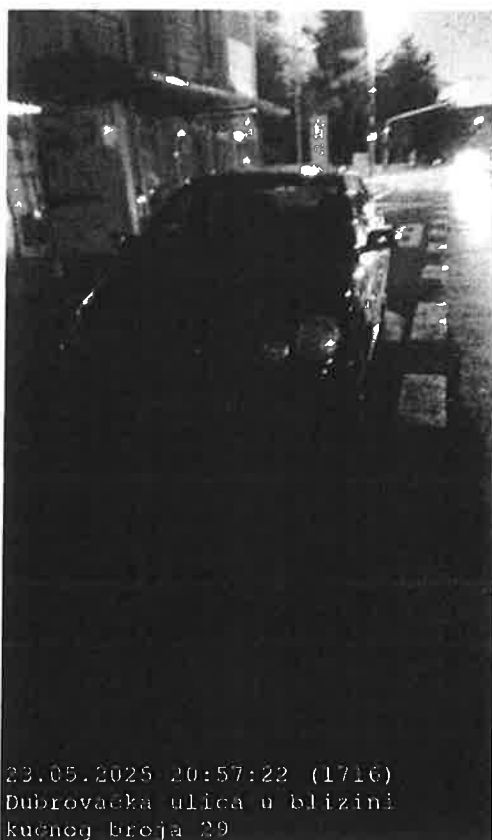
23.05.2025 20:57:22 (1716) Dubrovačka ulica u blizini kućnog broja 29